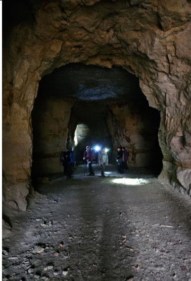
Ein kleiner Teil des Stollensystems von Schwalbe II