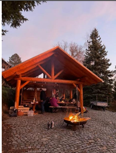
Entspannung bei Glühwein und Essen