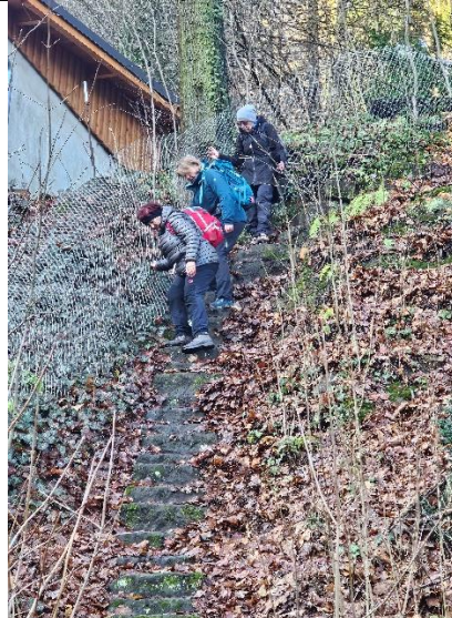
Vom Mausoleum Richtung Elbe ging es sportlich zu